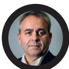
XAVIER BERTRAND PRÉSIDENT DU CONSEIL RÉGIONAL DES HAUTS-DE-FRANCE